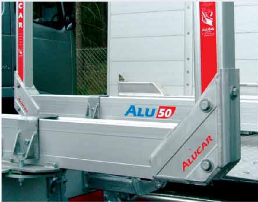
Tolppan kiinnitys pulttaamalla.